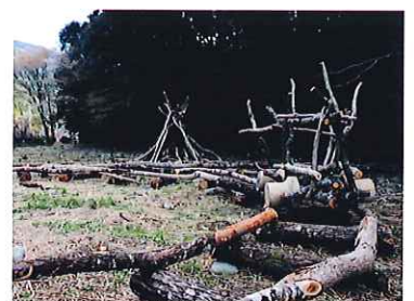
森のコースター2 / 夏池篤 (川根温泉世間渡駅)