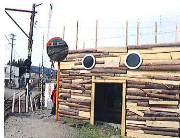
Me and My Monster (私とわたしの怪物) / しでかすおともち (代官町駅, 福用駅)