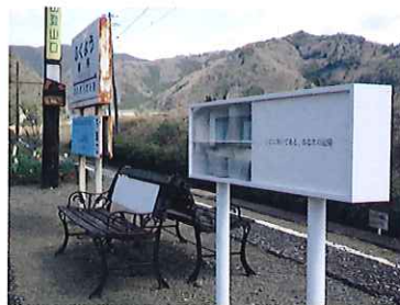
無人駅文庫 / 木村健世 (福用駅)