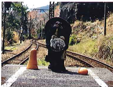
地蔵まえ / さとुरさ (神尾駅)

2019年3月8日(金) — 24日(日) / 17日間 大井川鉄道無人駅周辺(静岡県島田市・川根本町)